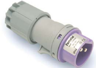
Ref. / Item 13800