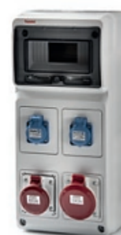
Ref. / Item 6504