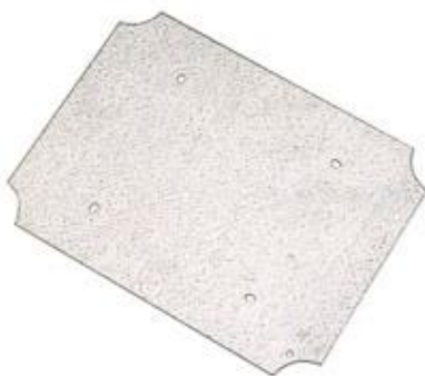
Ref. / Item 3054