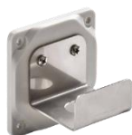
Placa metálica con soporte Metal plate with support Ref/Item 28000-MA