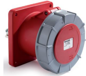
Ref. / Item 24377