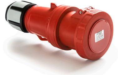
Ref. / Item 24305