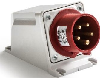
Ref. / Item 13764