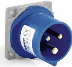
Ref. / Item 13634