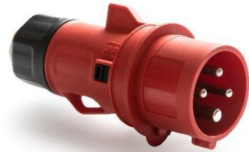
Ref. / Item 13300